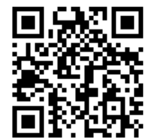
Montagefilm LS 2