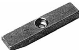
Paßfedern G DIN 6885 mit Schrägung