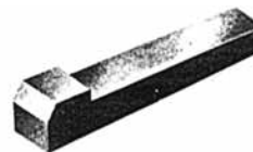
Nasenflachkeil DIN 6884 Nasenkeil DIN 6887