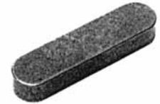
Paßfedern A DIN 6885