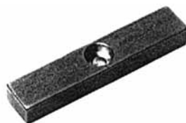
Paßfedern D DIN 6885