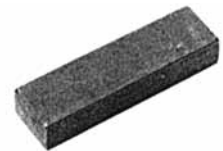
Paßfedern B DIN 6885