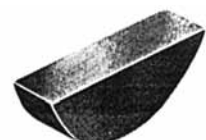
Scheibenfedern DIN 6888