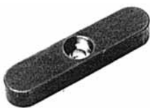
Paßfedern C DIN 6885