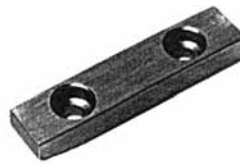
Paßfedern H DIN 6885 mit Schrägung