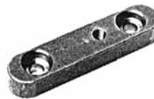
Paßfedern E DIN 6885 ab 12 x 8 mit Bohrungen für Abdrückschrauben