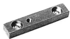
Paßfedern F DIN 6885 ab 12 x 8 mit Bohrungen für Abdrückschrauben