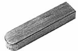
Paßfedern AB DIN 6885