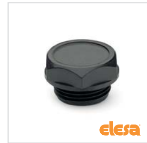
ELESA Original design TN.